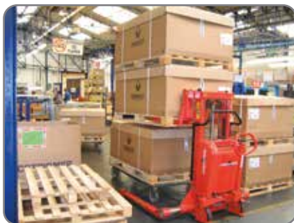
Stærk konstruktion sikrer lang levetid og lave vedligeholdelsesomkostninger.