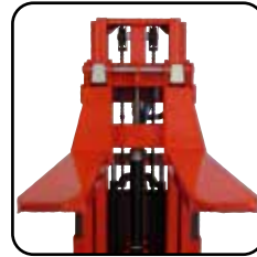
Justerbare gaffler fås i mange forskellige længder og typer.