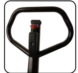
Ergonomisk håndtag giver brugeren et afslappet greb. Mulighed for mærkning af vognen med navn/afdeling.