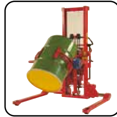
Fås med sidevippegaffler/ eller ekstra udstyr som f.eks. tøndevender, kranarm, fjernbetjening, spyd og positioneringudstyr.