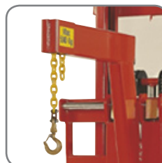
Kæden er justerbar og kan nemt og hurtigt reguleres.