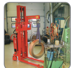
Metalruller løftes ind i en stansemaskine.

Vi tilbyder også kundetilpassede løsninger. Spørg efter flere informationer eller besøg www.logitrans.com .