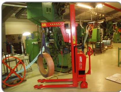
Her anvendes kranarmen i komponentindustrien.