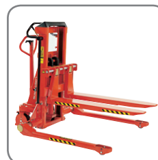
Kan leveres til Logiflex modeller med variabel gaffelkonsol.