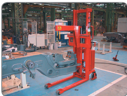
Her anvendes kranarmen i en virksomhed, der fremstiller komponenter til tog.