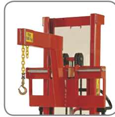
Quickskift gør det let at skifte kranarmen ud med andet ekstra udstyr eller gaffler.

Stærk konstruktion sikrer lang levetid og lave vedligeholdelsesomkostninger.