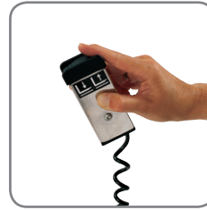
Hæve-/sænkefunktionen på de elektriske Logiflex-modeller kan betjenes med en fjernbetjening (ekstra udstyr).