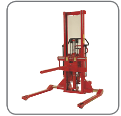
Af andet ekstra udstyr tilbydes bl.a. spyd, platform, rulle- og tøndevender.