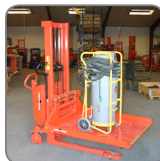
Her anvendes platformen til transport af en støvsuger.