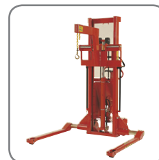
Af andet ekstra udstyr tilbydes bl.a. kranarm, spyd, rulle- og tøndevender.