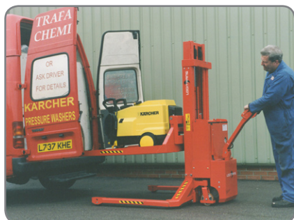
Her anvendes platformen til transport af en højtryksrenser.