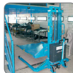
Logitrans' produktsortiment fås i alle RAL-farver.

Vi tilbyder også kundetilpassede løsninger.