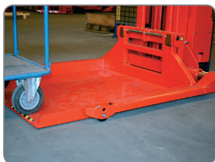
Platformen er affaset for lettere indkørsel.