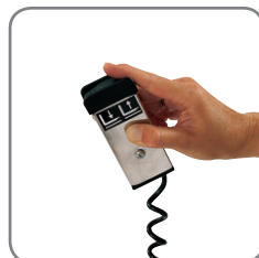
Fjernbetjening fås som ekstra udstyr.