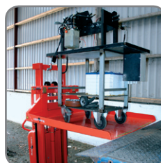
Logiflex med platform løfter her vogn fra rampe.