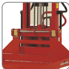
Quickskift gør det let at skifte platformen ud med andet ekstra udstyr eller gaffler.

Stærk konstruktion sikrer lang levetid og lave vedligeholdelsesomkostninger.