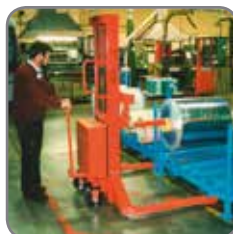
Her anvendes spydet i emballage-industrien.