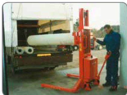
Her ses en skræve Logiflex ved håndtering af ruller fra lager til lastbil.