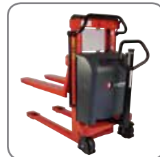
Vælges en Logiflex-model uden skræveben, skal rullen, der flyttes, ligge på en palle.