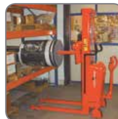
Her anvendes spydet på et lager.

Vi tilbyder også kundetilpassede løsninger. Spørg efter flere informationer eller besøg www.logitrans.com