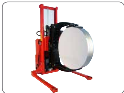
Rullerrotator - et godt alternativ, når ruller skal løftes og vendes.