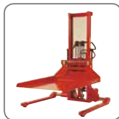
Af andet ekstra udstyr tilbydes bl.a. platform og kranarm.