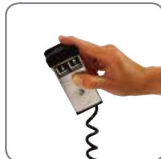
Hæve-/sænkefunktionen på de elektriske Logiflex-modeller kan betjenes med en fjernbetjening (ekstra udstyr).