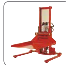
Quickskift-udstyr: Kranarm, spyd, platform, rullehorn, rulle-gafler og tøndeveder.