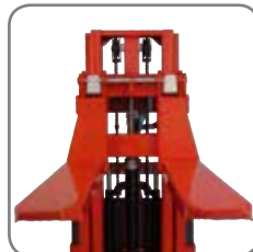
Med quickskift-systemet er det nemt og hurtigt at skifte mellem gafler og udstyr.