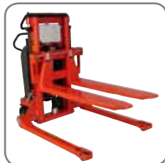
Gaflerne kan monteres på alle Logiflex-modeller med og uden skræveben.

Massive gafler: Lave gafler, der bruges, hvis højden under byrden, der skal løftes, er lav.